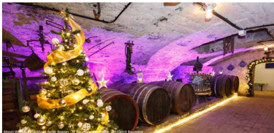
Mosel-Wein-Nachts-Markt Keller Bogner

p. P. im Doppelzimmer 299,- € Einzelzimmerzuschlag: 84,- €