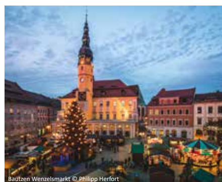
Bautzen Wenzelsmarkt

ist. Weiter geht es zu einer kleinen Rundfahrt nach Zittau. Mit seiner denkmalgeschützten Altstadt darf Zittau sich zu den schönsten Städten des Freistaates Sachsen rechnen. Anschließend fahren wir in das Zittauer Gebirge - den „hintersten Winkel“ Deutschlands. Dabei kommen wir natürlich auch nach Oybin, dem bekannten Ort am Fuße des gleichnamigen Sandsteinberges. Berg und Burg, von der heute nur noch Ruinen erhalten sind, waren ein viel besuchtes Ziel romantischer Maler, allen voran Caspar David Friedrich. In einem Landgasthof im Zittauer Gebirge erwartet uns ein Adventsprogramm mit einem weihnachtlichen Kaffeegedeck. Am Nachmittag fahren wir zurück nach Bautzen.