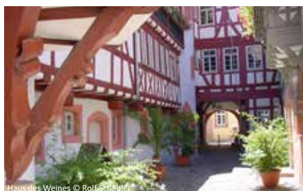
Haus des Weines

fels mit seinen hübschen Fachwerkhäusern. Auf unserer Rundfahrt besuchen wir auch die bekannten Orte Rhodt unter Rietburg mit der bekannten Theresienstraße, der vielleicht urtypischsten Straße der Pfalz und St. Martin mit seinem idyllischen Ortskern, typischen Winzerhöfen und der Katharina von Dalberg. Für das Abendessen empfehlen wir Ihnen eines der zahlreichen Lokale in der historischen Altstadt auszuwählen (2 Gehminuten vom Hotel). Wir wünschen Ihnen einen Guten Appetit!