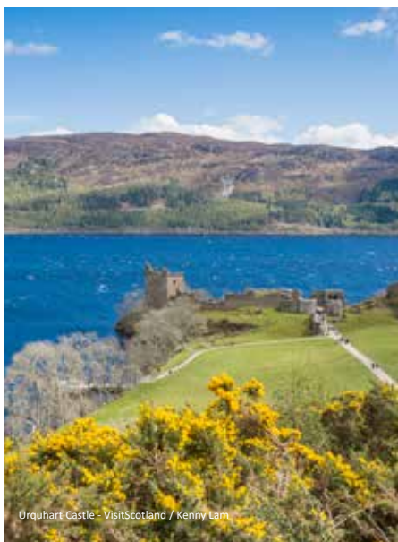
Urquhart Castle

Ausgeruht beginnen wir den Tag mit einem ausgiebigen Frühstücksbüfett an Bord. Im englischen Hafen in Hull werden wir bereits von unserer örtlichen Reiseleitung erwartet, die uns auf dem Weg nach Norden auf die kommenden Tage einstimmen wird. Die Fahrtroute führt gen Norden zur schottischen Grenze. Den ersten Halt machen wir in Gretna Green, wo wir die ehemalige Hochzeitschmiede besichtigen. Am Nachmittag steht noch eine Stadtrundfahrt in Glasgow auf dem Programm. Die ehemalige europäische Kulturhauptstadt ist reich an viktorianischen Schätzen und hat in den vergangenen 15 bis 20 Jahren große Sum-