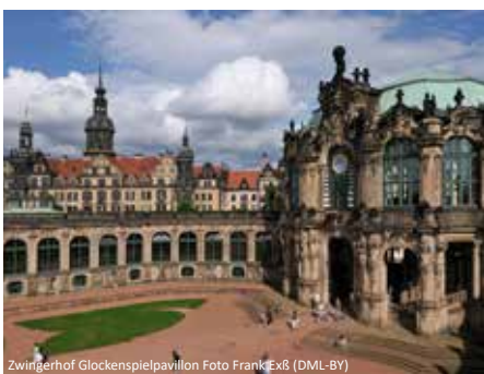
Zwingerhof Glockenspielpavillon

Die weltbekannte Berühmtheit „Elbflorenz“, so der Beiname Dresdens, gründet sich auf die reichen Kunstsammlungen und die eindrucksvollen Baudenkmäler. Dresden ist international anerkannte Wissenschaftsstadt, bedeutende Industriestadt und Kulturstadt ersten Ranges. Erleben Sie mit uns bei dieser Fahrt den Flair dieser Stadt. Damit Sie den Aufenthalt bestmöglichst genießen können, haben wir ein Hotel direkt im Stadtzentrum reserviert. Das Programm ist so gestaltet, dass Sie während der Tagesausflüge ein möglichst umfassendes Bild von Dresden bekommen.