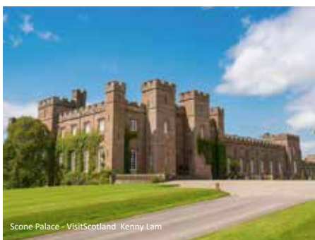
Scone Palace

Den heutigen Tag verbringen wir ganz in Edinburgh. Sie werden von der Schönheit der schottischen Hauptstadt beeindruckt sein! Die zahlreichen Sehenswürdigkeiten, die uns Edinburgh bietet, werden ein weiterer Höhepunkt unserer Reise sein. Über das Kopfsteinpflaster des Grassmarkets mit seinen bunten Pubs und Ladenfronten geht es zum mächtigen Edinburgh Castle. Von hier aus offenbart