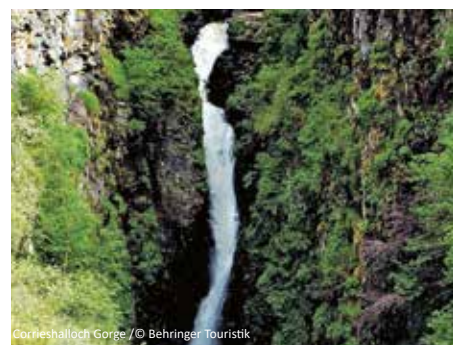
Corrieshalloch Gorge

Nach dem Frühstück starten wir mit unserer örtlichen Reiseleitung zu einer beeindruckenden Rundfahrt durch das schottische Hochland und an die herrliche Atlantikküste. Wir passieren an diesem Tag karge Täler, Wasserfälle und Schluchten und erleben die grandiose Landschaft der Highlands, die sich in zahllosen Seen und Fjorden spiegelt - Besonderheiten für die Schottland so berühmt ist. Ein erster Höhepunkt ist Corrieshalloch Gorge - hier können Sie die imposante Hängebrücke sowie beeindruckende Wasserfälle bestaunen. Weiter geht es durch eine wirklich beeindruckende Landschaft an der Nordwestküste von Schottland. Am Nachmittag folgt mit dem Besuch von Inverewe Gardens noch ein weiterer Höhepunkt. Hier lässt das unerwartet milde Klima exotische Pflanzen gedeihen. Sie