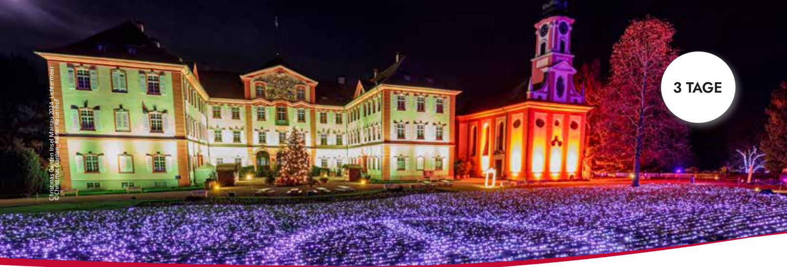
Christmas Garden Insel Mainau 2024, Lichtermeer