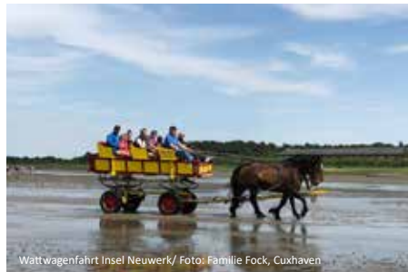
Wattwagenfahrt Insel Neuwerk

2. Tag: Donnerstag, 28.05. / 13.08.26 Insel Neuwerk Heute haben wir ein besonderes Erlebnis für Sie im Programm. Von Sahlenburg aus starten wie zu einer Fahrt mit dem Wattwagen auf die Insel Neuwerk. Schon die Kutschfahrt wird Ihnen viele positive Eindrücke und Erinnerungen bieten. Die Insel mit einer Fläche von 3 km 2 gehört verwaltungsmäßig zur Hansestadt Hamburg. Nach einem Aufenthalt von ca. 1 Stunde bringen uns die Pferdekutschen nach Sahlenburg zurück. Mit unserem Bus geht es dann wieder nach Bremerhaven.