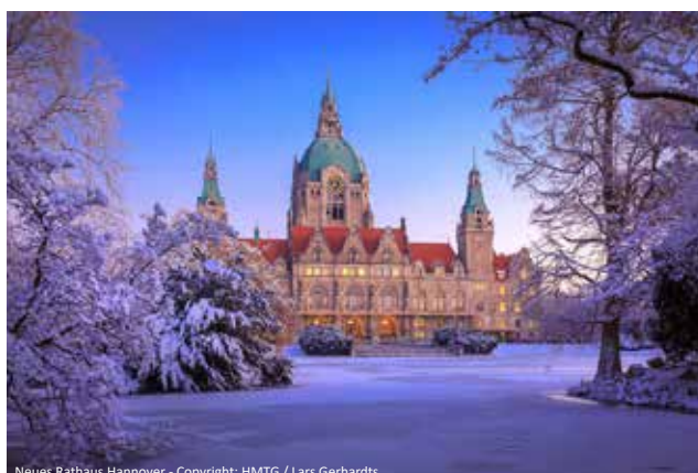
Neues Rathaus Hannover

p. P. im Doppelzimmer 299,- € Einzelzimmerzuschlag: 50,- €