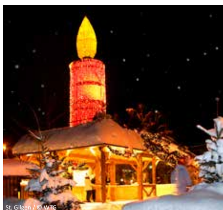
St. Gilgen

p. P. im Doppelzimmer 429,- € Einzelzimmerzuschlag: 30,- €