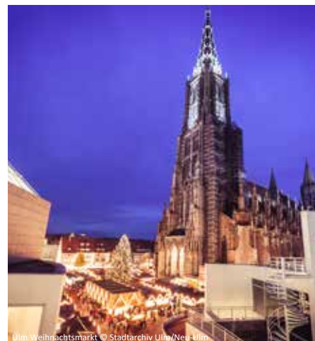
Ulm Weihnachtsmarkt

Nach dem Frühstück starten wir zu einer Stadtführung in der Stifts- und Reichsstadt Kempten mit Besuch der Multivisionsshow in den unterirdischen mittelalterlichen Gemäuern der ehemaligen Erasmuskapelle. Anschließend haben Sie ausreichend Zeit für einen Bummel über den schönsten Weihnachtsmarkt im Allgäu. Um ca. 14.30 Uhr treten wir die Heimreise an.