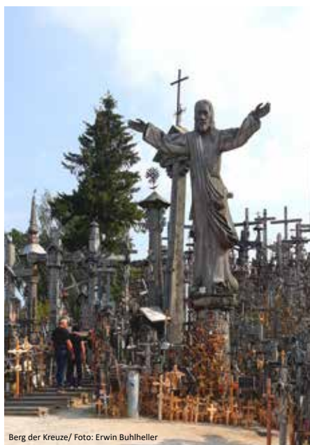
Berg der Kreuze

Zunächst schauen wir uns noch den Teil von Klaipeda an, den wir am Vortag nicht mehr geschafft haben, bevor Sie die wunderbare Landzunge zwischen der Ostsee und dem