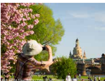
Blick auf die Frauenkirche

Heute haben Sie die Möglichkeit, den Tag in Dresden ganz nach Ihren Vorstellungen zu