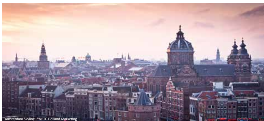
Amsterdam Skyline

p. P. im Doppelzimmer 379,- € Einzelzimmerzuschlag: 120,- €