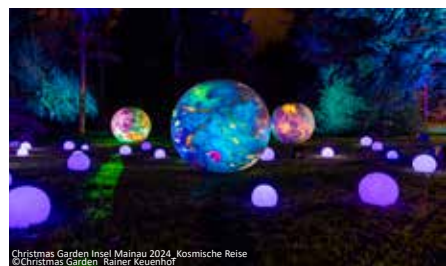
Christmas Garden Insel Mainau 2024, Kosmische Reise

Anreise nach Radolfzell am Bodensee. Hier beginnen wir unseren Aufenthalt mit einem geführten Spaziergang durch die Stadt. Wir kommen auf die großen Plätze und in die schmalen Gassen der Altstadt. Dabei erfahren Sie auch immer wieder spannende Anekdoten von der Gründung Radolfzells bis in die Moderne. Im Laufe der Jahrhunderte entwickelte sich Radolfzell am Bodensee vom Fischer- und Weinbaudorf zur drittgrößten Stadt am Bodensee. Nach dem Hotelbezug haben Sie dann noch etwas Zeit zur freien Verfügung, bevor wir mit einbrechender Dunkelheit zur Insel Mainau fahren. In der magischen Kulisse des Christmas Garden verwandelt sich die Insel in ein leuchtendes Winterwunderland. Millionen funkelnder Lichter, kunstvolle Illuminationen und märchenhafte Installationen sorgen für ein unvergessliches Erlebnis. Schlendern Sie entlang der leuchtenden Pfade und genießen Sie die stimmungsvolle Musik – ein Fest für die Sinne! Übernachtung in Radolfzell.