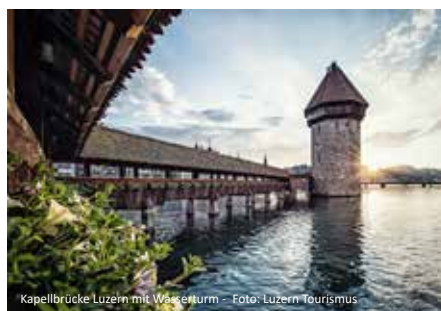
Kapellbrücke Luzern mit Wasserturm

mit unserem Bus die wenigen Kilometer zur Talstation nach Alpnachstad fahren. Hier verlassen wir unseren Bus und fahren mit der steilsten Zahnradbahn der Welt auf den Pilatus. Hier erwartet Sie ein einmaliges Erlebnis. Sie kommen nicht nur als Tagesgast auf den Berg, sondern wir haben für Sie im, auf 2.132 m Seehöhe liegenden, Hotel Bellevue ein Zimmer reserviert. Genießen Sie in Ruhe die herrliche Aussicht von Ihrem Zimmer oder von der Panoramaterrasse aus. Im Hotel werden wir auch das Abendessen einnehmen und Sie können anschließend den wunderschönen Sonnenuntergang genießen.