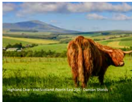
Highland Cow

sich ein toller Blick über die Stadt und im Innern authentische Einblicke in Schottlands Vergangenheit. Die breite Promenade Royal Mile führt vom Schloss bis zur königlichen Residenz. Der Nachmittag steht Ihnen zur freien Verfügung. Kaufen Sie landestypische Mitbringsel wie Scones, Kilt oder Tee und genießen Sie es hier zu sein! Am frühen Abend fahren wir wieder in unser Hotel. Abendessen im Hotel.